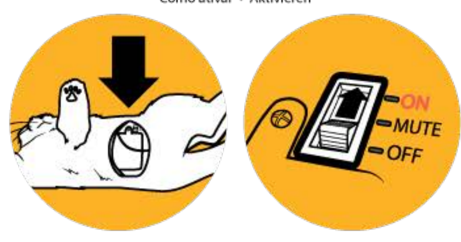
To play without sounds • Mode muet • Jugar sin sonido Para brincar sem som • Stummschalten

To activate • Activation • Activar Como ativar • Aktivieren